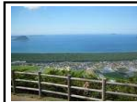
鏡山展望台 虹ノ松原の眺望が楽しめます。