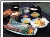
呼子 イカ活造りの昼食 (イメージ写真)