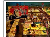
マリンセンターおさかな村 鮮魚や海産物の販売、マグロの 解体ショーなどを行っている