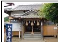
宝当神社 約400年前、野崎隠岐守綱吉 という文武に猛た方が1人で 高島にやって来て開拓した 高島にある宝くじが当たる 神社として有名。