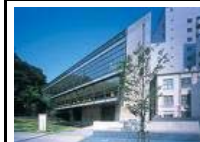
坂の上の雲ミュージアム 司馬遼太郎の小説「坂の上の雲」にまつわる資料などを展示。世界的建築家安藤忠雄氏設計。