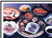
三崎漁師物語り 波綾膳 (1人前 3,675円 税込)