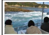
能登島潮流体験 国指定史跡の「能島」周辺を周り、日本有数の潮流を間近で体験できます。