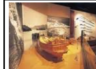
村上水軍資料館 2階の資料展示室では瀬戸内海における能島村上水軍の活躍を古文書や復元品を通して紹介しています。